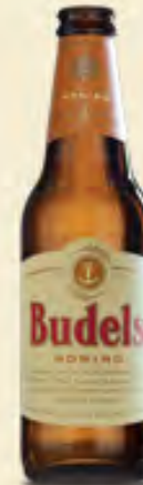
Budels Honing Bio