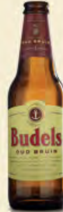
Budels Oud Bruin