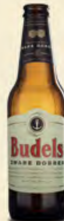
Budels Zware Dobber