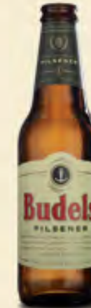
Budels Pilsener Bio